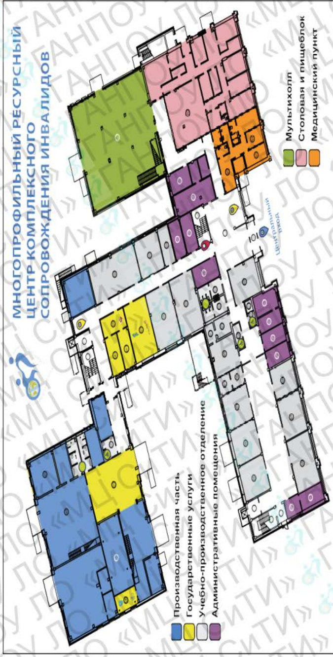
Рисунок 1. Многопрофильный ресурсный центр комплексного сопровождения инвалидов