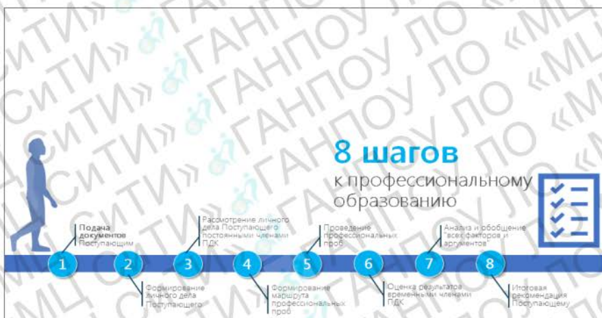
Рисунок 2 – Алгоритм профессиональной диагностики

На основе анализа документов личного дела Поступающего (документа об образовании/свидетельства об обучении, ИПРА с рекомендуемыми мероприятиями по общему и профессиональному образованию, по профессиональной реабилитации или абилитации, о показанных и противопоказанных видах трудовой деятельности, условиями труда, медицинской документации и пр.), беседы с Поступающим (в рамках профессиональных компетенций Постоянных членов ПДК) определяется возможности кандидата к обучению и дальнейшему трудоустройству. Это позволяет определить профессиональные интересы и мотивацию Поступающего, и соотнести ее с нормативно-правовой базой медиков, специалиста по охране труда, дефектолога о возможности трудоустройства по рекомендуемым профессиям. Также проводится опрос и