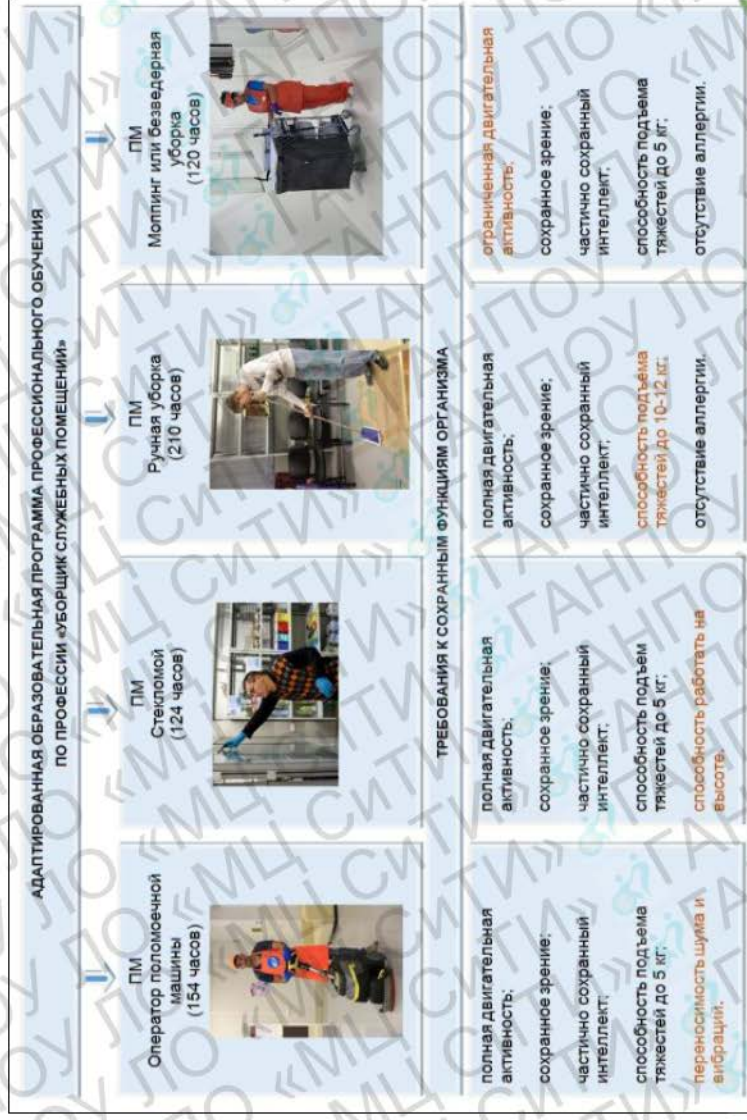
Рисунок 5 - Модульное деление программы «Уборщик служебных помещений»