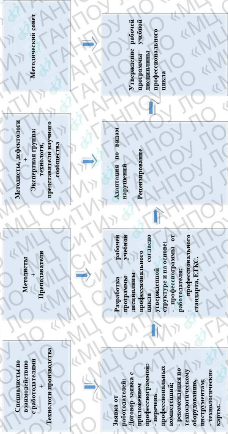
Рисунок 3 - Алгоритм разработки рабочей программы учебной дисциплины профессионального цикла